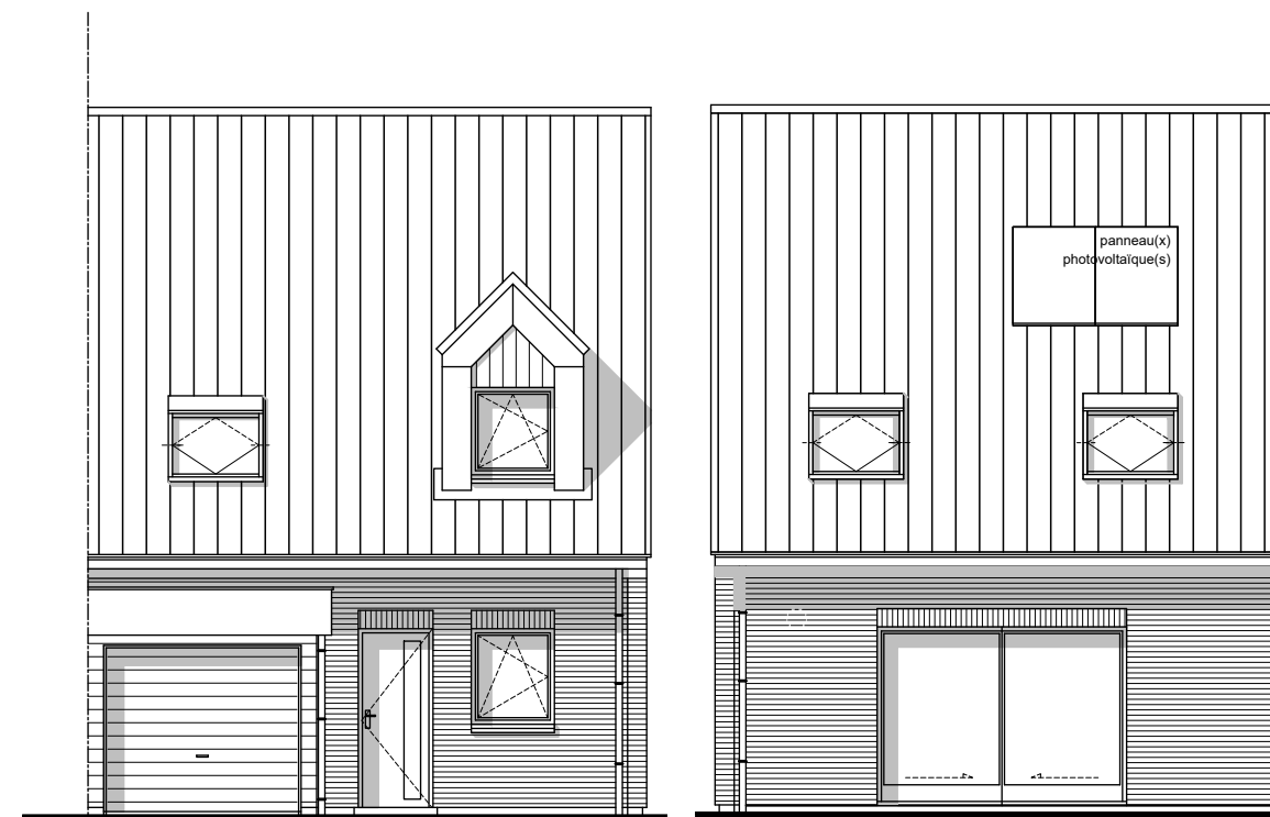
Façade sur entrée